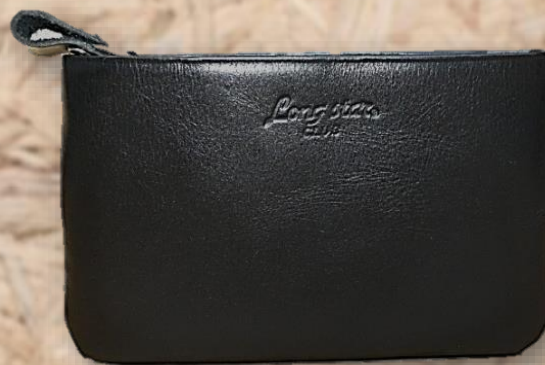
品番 6 品名 牛革小銭入 カラー クロ サイズ 11 × 6.5