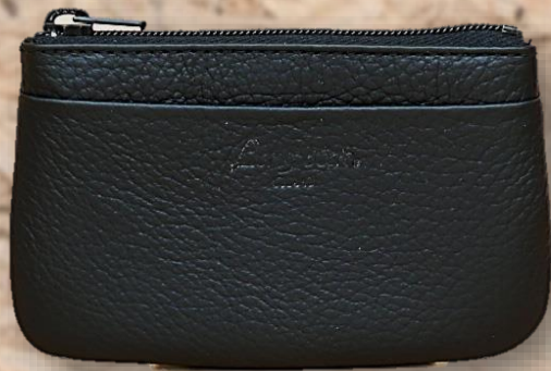
品番 2 品名 牛革小銭入 カラー クロ サイズ 10.5 × 6.