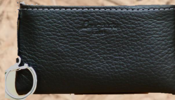
品番 4 品名 牛革小銭入 カラー クロ サイズ 11 × 6