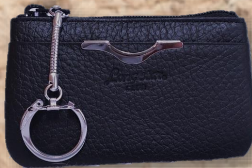
品番 3 品名 牛革小銭入 カラー クロ サイズ 10.5 × 6.