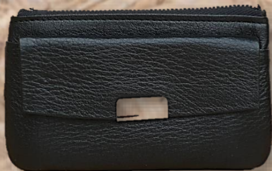
品番 5 品名 牛革小銭入 カラー クロ サイズ 10.5 × 6