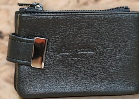
品番 8 品名 牛革小銭入 札入 カラー クロ・チョコ サイズ 9 × 6